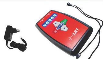
高达每分钟 49,999 次闪光