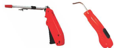
快速挂钢丝圈工具 卸钢丝圈工具