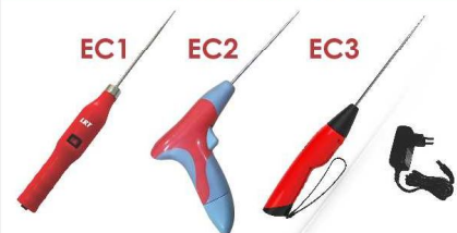
可供有150, 200 & 300 mm长度选择